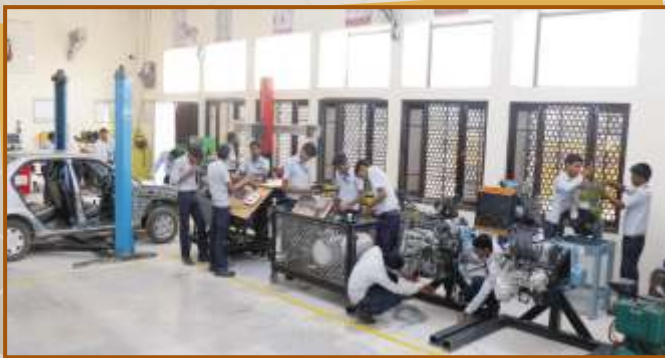
Mechanic Motor Vehicle Workshop