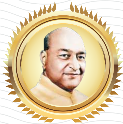
Sir Padampat Singhania (1905-1979)