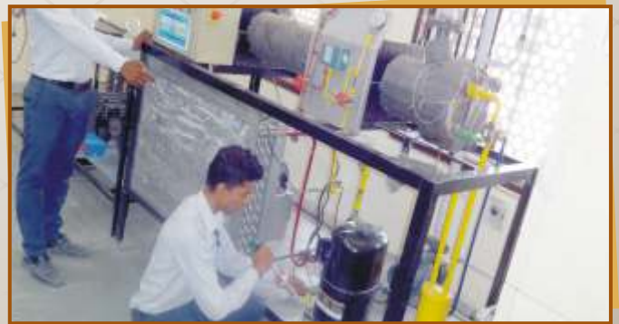
Mechanic Refrigeration & Air Conditioner